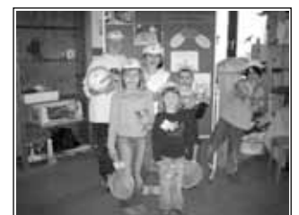
Freude über Geschenke der Sparkasse Goslar/ Harz