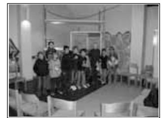
Die beteiligte Kindergruppe des KJT Am Hamberg