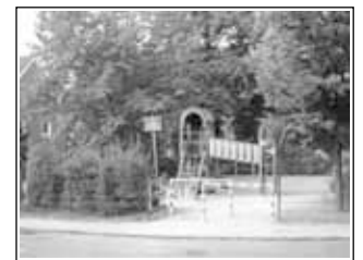
Der Spielplatz heute

Baubeginn ist Anfang Juli. Etwa vier Wochen später wird der Spielplatz dann in einem neuen Glanz erstrahlen. Die Eröffnung des Spielplatzes ist für den 31. August 2006 geplant. Es wird am Nachmittag ab 15:00 Uhr die Gelegenheit geben, den Planungsprozess nochmals nachzuvollziehen, die neuen Spielgeräte auszuprobieren und zusätzlich werden viele andere Unterhaltungsangebote für Kinder geboten.