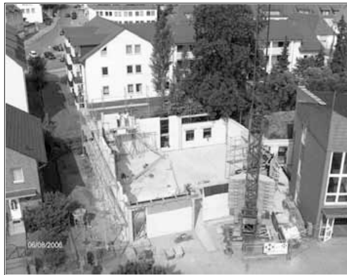
Rohbau des neuen Gottesdienstraumes

Neben der 1960 erbauten Erlöserkirche entsteht ein neuer Gottesdienstraum; die alte Kirche wird vollständig umgebaut. Durch den ebenerdigen Eingang und den Einbau eines Aufzuges erhalten alle Gemeinderäume einen behindertengerechten Zugang.