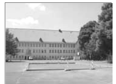
Bald wird hier gebolzt

Angekündigt war das DFB-Minispield schon für dieses Jahr. Aber wie auf vielen Baustellen, sind Zeitpläne schnell mal überholt. Nun wird im nächsten Frühjahr ein neuer Anlauf genommen. Wenn die Witterung es wieder zulässt, wird das DFB-Minispield auf dem Schulhof der Grundschule Ziesberg fertig gestellt, pünktlich zur kommenden Sommersaison. Der städtische Eigenbetrieb Gebäudemanagement, Einkauf und Logistik kümmert sich darum.