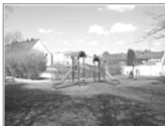
Hier werden bald nach den Wünschen der Kinder andere Spielmöglichkeiten entstehen

In den ersten Monaten des kommenden Jahres wird das beauftragte Planungsbüro planungsgruppe 91 aus Salzgitter mit Unterstützung des Stadtbüros Ost- und Westsiedlung, des Stadteitreffs NOW und des Kinder- und Jugendtreffs Hamberg gemeinsam mit Kinder und Jugendlichen aus der Ost- und Westsiedlung und den Anwohnern einen neuen „Roxy-Spielplatz“ entwerfen. Ziel ist es, noch im Laufe des Jahres 2009 den Spielplatz umzugestalten. Damit wird neben dem umgestalteten Martin-Luther-Platz, dem neu eröffneten Stadteitreff NOW inmitten der Ost- und Westsiedlung auch das Spielangebot aufgefrischt.