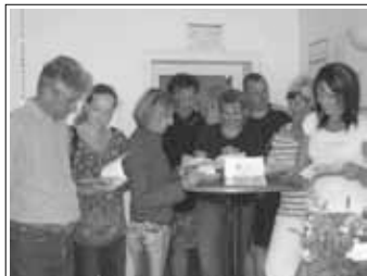
Kindergarteneltern schauen sich die neue Konzeption an

Das neue Konzeptionsheft des Katholischen Kindergartens Christ-König liegt vor. „Bildungsräume eröffnen“ heißt der rote Faden, der sich durch die gesamte Konzeption zieht. Das Heft ist im Kindergarten erhältlich.