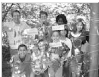
Ein echter Spaß, der Kinderferienspaß

Schon jetzt ist auf Grund der guten Erfahrungen eine nächste Ferienaktion für die Osterferien 2009 geplant. Thema wird das Spielen sein... Genaueres wird rechtzeitig bekannt gegeben.