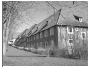
Der Burghof noch im „alten Kleid“

wir uns bei Bedarf um Küche und Fußböden und passen den Wohnraum den Mieterwünschen an. Die Wohnungen werden gestrichen und modernisiert. „Wegen der vielen Neuvermietungen an Familien und zu Semesterbeginn an Studenten haben wir vor allem im September und Oktober viel Zeit und Geld in die Wohnungen investiert“, so Hoffmann. Die Außensanierung am Burghof musste verschoben werden, weil die Witterung ab November Arbeiten an der Fassade unmöglich macht. Das Unternehmen investiert insgesamt 2,5 Millionen Euro in die Wohnanlage, um die Siedlung langfristig als attraktiven Standort zu etablieren.