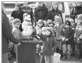
Eifrige kleine Müllsammelnde mit Begeisterung bei der Sache

Beim Naschen der von Frau Schulze verteilten Süßigkeiten war für die Kinder klar, dass die Verpackung selbstverständlich in die Mülltonne gehört. Und so bleibt zu hoffen, dass die kleinen Müllsammelnde auch künftig mit darauf achten, dass die Siedlung sauberer wird.