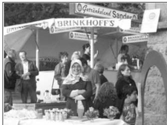
TorFestival, September 2008

Zum diesjährigen TorFestival wird bereits vor den Sommerferien eingeladen; 05.06. zwischen 16 und 20 Uhr. Auch hierzu laufen die Vorbereitungen. Unter den Torbögen Ecke Breite Str./Weserstr. ist wieder Straßenfestatmosphäre geplant mit Livemusik, Essen und Trinken.