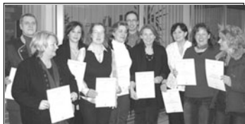
Die Erziehungslotsen mit ihren Zertifikaten

Dieses Förderprojekt des Landes Niedersachsen wird vom Fachdienst Kinder-Jugend und Familie der Stadt sowie von der katholischen (KFB) und der evangelischen Familienbildungsstätte (EFB) getragen.